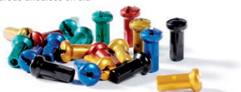
Écrous en acier zingué